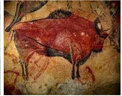
malowidło w Altamirze

Przejście z koczowniczego trybu życia na osiadły miało miejsce około 10 tys. lat temu. W tym okresie kończyła się epoka lodowcowa (ostatnie zlodowacenie). Klimat się ocieplił, rozrastały się lasy, a zmniejszyły swój obszar tundry, stepy i sawanny bogate w zwierzynę, np. mamuty, renifery, bizony (czas wielkich polowań, wielkich łowców dobiegał końca, stada zwierząt były coraz mniejsze). Ludzie zaczęli samodzielnie uprawiać dzikie odmiany roślin (wody było dużo po stopnieniu lodowca) oraz hodować zwierzęta.