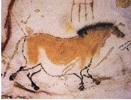
malowidła w Lascaux

W okresie paleolitu głównym sposobem zdobywania pożywienia było łowiectwo. W okresie zlodowacenia, pod koniec paleolitu, rozległe były obszary tundry, na której pasły się stada zwierząt. Wspaniali łowcy tworzyli malowidła na ścianach jaskiń, których tematem są polowania.