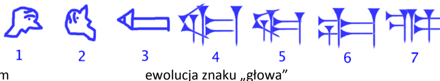
ewolucja znaku „głowa”